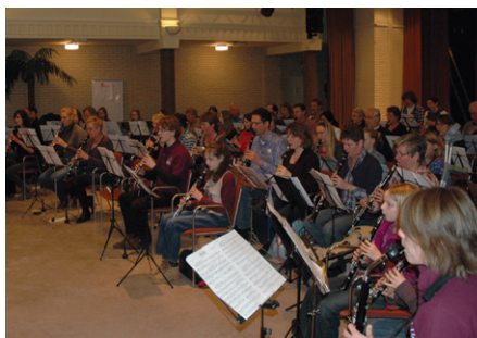
Megaklarinetorkest in Voorschoten